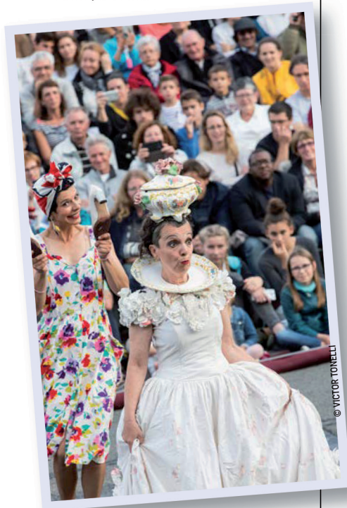
🚩 Royal de Luxe

L'avenue Henri-Barbusse transformée en « catwalk »? C'est le show XXL d'Art Point M, et LE projet participatif des Invites 2019. La compagnie venue de Roubaix montera devant l'hôtel de ville une grande scène et un podium de 50 mètres de long, végétalisés, sur lequel défileront les 200 Villeurbannaises et Villeurbannais sélectionnés lors de quatre jours de casting. Le seul critère de sélection sera l'envie de participer à cette aventure singulière qui mêle vidéo, arts plastiques et musique électro. Pour ce défilé qui sera présenté deux soirs consécutifs, les mannequins du jour porteront les modèles créés à partir de vêtements collectés auprès des habitants. Une mode éthique, à contre-courant d'un secteur aujourd'hui reconnu comme le deuxième pollueur au monde. Des containers, eux aussi sur l'avenue, compléteront l'installation : chacun pourra s'y faire photographier ou investir un espace d'expression libre.